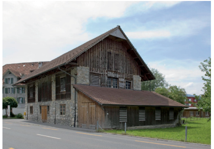
Bild oben: Ansicht von Südwesten Bild unten: Ansicht von Nordosten

Der O-lich des Hauptgebäudes liegende Gaden ist aus Bruchsteinen gemauert, im oberen Teil durch Ständerbauteile aufgelockert, wobei an der S-seite eine sehr unpassende Holzverkleidung angebracht wurde. Das gerade Satteldach über der kunstvoll gearbeiteten Dachuntersicht ist mit Falzziegeln gedeckt. O-seitig wurde ein mit Biberschwanzziegeln einfach gedeckter Pultdachanbau erstellt.