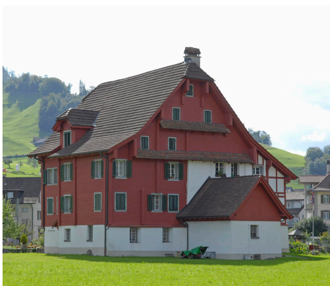
Bild oben: Ansicht von Südwesten Bild unten: Ansicht von Nordosten

Bei der Renovation von 1860 wurden die Fenster versetzt und die Fassaden verschindelt. 1982 und 1996 in ursprüngliches Erscheinungsbild zurückversetzt.