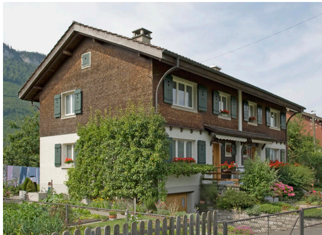
Bild oben: Ansicht von Nordosten Bild unten: Ansicht von Südwesten

Zwei traufständige, zweigeschossige, achsialsymmetrische Doppelwohnhäuser mit Satteldach. Das Obergeschoss ist mit einem naturbelassenem Holzschindelschirm versehen, der massive Sockel ist verputzt. Die Überdachung der Zugänge nimmt formale Stilelemente des ländlichen Bauens auf. Der Garten ist in einen vorderen, repräsentativen Zwecken dienenden und in einen hinteren Nutzgarten unterteilt.