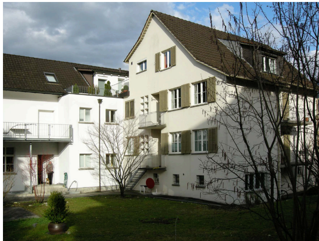
Bild oben: Ansicht von Südosten Bild unten: Ansicht von Südwesten

1951 wurde ein Zweifamilienhaus an das Ateliergebäude angebaut.