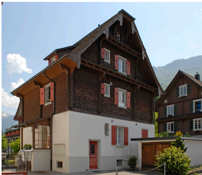
Bild oben: Ansicht von Nordosten Bild unten: Ansicht von Nordwesten

Zweigeschossiges Wohnhaus unter Krüppelwalmdach. Die Fassadenentwicklung mit gemauertem Sockel, Obergeschoss in Holz mit Schindelschirm sowie die Klebdächer verweisen auf die Innerschweizer Bauernhausarchitektur, wohingegen die expressiv gestalteten Fensterumrahmungen in Holz als klare, moderne Kontraste gesetzt sind.