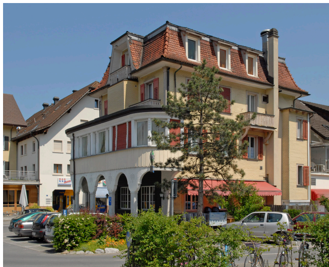
Bild oben: Ansicht von Nordwesten Bild unten: Ansicht von Nordosten

Ehemals zweigeschossiges Chalet im Schweizerhausstil, um 1908 Aufstockung und neues Mansarddach mit Heimatstilanleihen. Umlaufende Terrasse im Obergeschoss auf Gusseisensäulen. Verspielte Holzarbeiten an Balkongeländern, Fenstergewänden und im Giebelbereich. 1920/1930 weitere Um- und Ausbauten des ersten Obergeschosses als auskragender Saalbau über Arkaden. Bis heute mehrfach umgebaut.