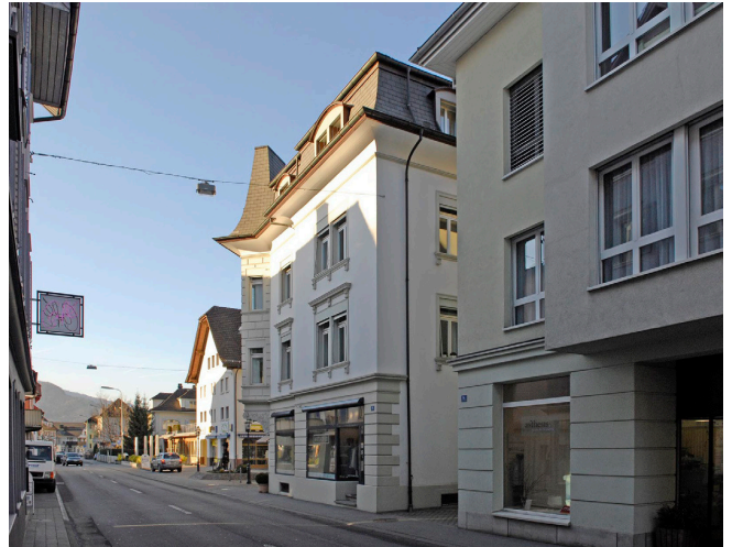
Bild oben: Ansicht von Südwesten Bild unten: Ansicht von Südosten

Dreigeschossiger Eckbau mit übereckgestellter Fassade unter Mansarddach. Die leicht eingezogene Eckpartie wird durch den rustizierten, zweigeschossigen Erkerturm betont. Das ebenfalls rustizierte Sockelgeschoss mit den maskenverzieren Erkerkonsolen, die Fensterverdachungen und -konsolen des ersten Obergeschosses sowie die ehemalige Dachgaube mit elliptischer Öffnung verleihen dem Haus den städtischen Habitus des späten 19. Jahrhunderts. Im Türsturz des Hauseinganges Familienwappen der Engelberger. 1970 Um- und Anbau Magazin durch Architekt Hans Reinhard, Hergiswil.