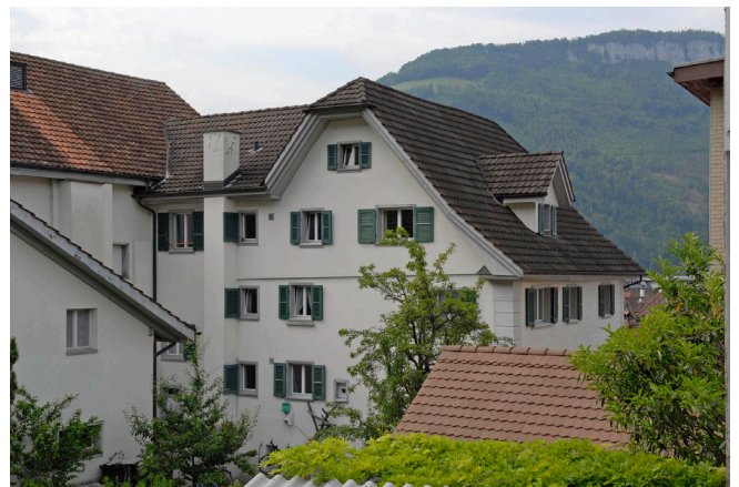
Bild oben: Ansicht von Nordosten Bild unten: Ansicht von Südosten

Steinbau unter leicht geknicktem Krüppelwalmdach, fein verputzt mit gemalten Eckquadrierungen. N-seitig drei Schaufenster eingebaut. Die Fenster in Holzgewände sind regelmässig angeordnet. Das Haus ist mit dem Theater (Theater an der Mürg) zusammengebaut, der Eingang befindet sich im Zwischenbau. Mehrmals umgebaut und renoviert.