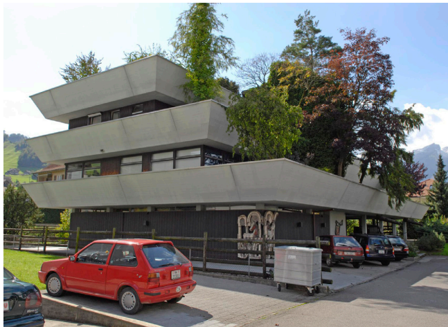
Bild oben: Ansicht von Südwesten Bild unten: Ansicht von Nordosten

Langgezogenes, viergeschossiges Wohn- und Geschäftshaus mit weit auskragenden, abgewinkelten Sichtbetonbalkonen. Die umlaufenden Balkone ergeben im Wechsel mit den dunkel gehaltenen, holzvertäfelten Wandflächen der einzelnen Geschosse eine unverwechselbare horizontale Schichtung, die in der Tradition eines Frank Lloyd Wright steht und speziell im Terrassenwohnbau der Schweiz (bsp. der Architekten Stucky & Meuli) vielfach angewendet wurde.