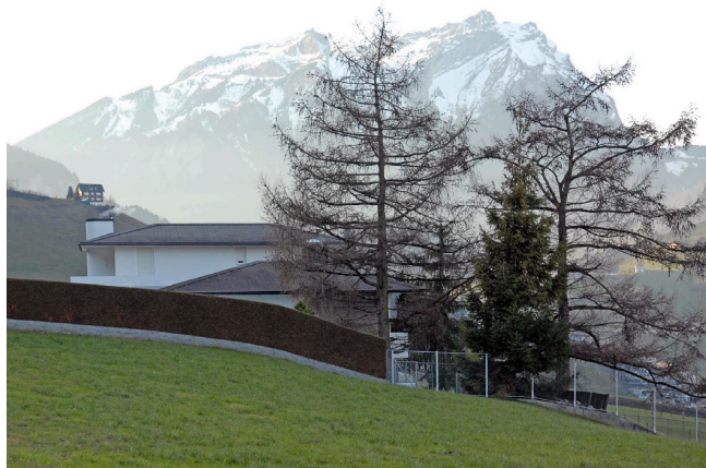
Bild oben: Ansicht von Südwesten Bild unten: Ansicht von Südosten

Langgezogene Villa am Nordhang des Stanserhorns. Entsprechend der Hanglage ist das Haus eingeschossig gegen den Berg und zweigeschossig gegen das Tal, wobei ein Bauteil einem Querschiff gleich das Haus um ein Stockwerk überragt. Die weit in die Landschaft greifende Anlage wird von flachen Walmdächern bedeckt.