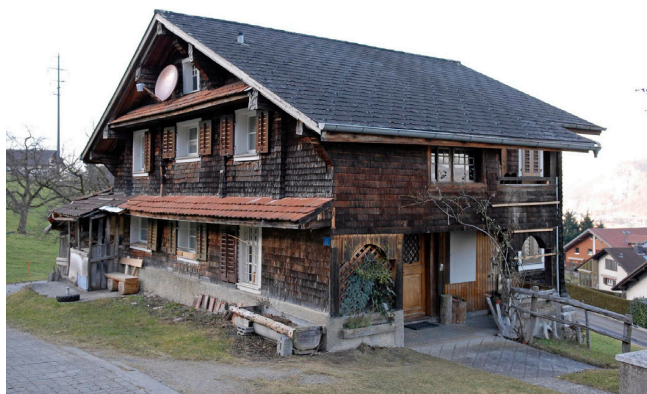
Bild oben: Ansicht von Nordwesten Bild unten: Ansicht von Südosten

Der dreigeschossige Bauernhaustyp wird von einem flachgeneigten Satteldach gedeckt. Typische Bauernhauselemente wie Holzschindelschirm, mit Holzschindeln verkleidete Blockvorstösse und beidseitige Lauben. Die Frontseite ist fünfschsig.