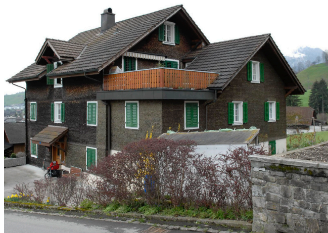
Bild oben: Ansicht von Nordosten Bild unten: Ansicht von Südwesten

Traufständiger, zweigeschossiger Holzbau unter Satteldach mit geländeaufnehmendem massivem Sockel. Bauernhauselemente: Satteldach, Holzschindelschirm. Sattelgaube über dem Eingang an der Nordwestfassade. Grosser Anbau an der Südwestfassade. 1984 Umbau und Fassadenrenovation.