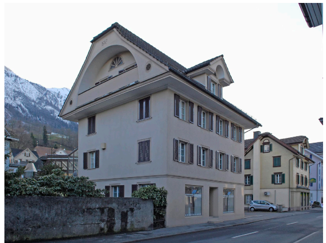
Bild oben: Ansicht von Nordwesten Bild unten: Ansicht von Nordosten

1946 Umbau Wohn- und Geschäftshaus. 1977 Fassaden- und Dachrenovation. 1990 Aussenrenovation.