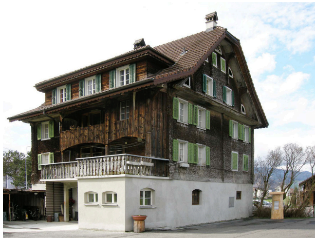
Bild oben: Ansicht von Südwesten Bild unten: Ansicht von Nordosten