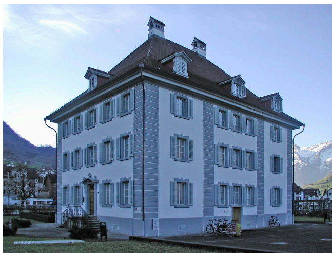
Bild oben: Ansicht von Südwesten Bild unten: Ansicht von Nordosten

Dreigeschossiger Bau mit hohem Walmdach. Die siebenachsigen Längsseiten werden in einen dreiachsigen Mittelteil und zweiachsige Randteile durch Steinquader und Dachgaube strukturiert. Sockelrand und Eckquader umfassen die Fassaden. An der SO-lichen Fassade führt eine doppelläufige Treppe zum Eingangsportikus, der mit Sandsteinarbeiten verziert ist. Das herrschaftliche ehemalige Wohnhaus im Empire-Stil besitzt ein überaus grosszünftig gestaltetes Treppenhaus. Die grossherrschaftliche Baute büsste ihre adäquate Umgebung weitgehend ein. Ehemaliges Wohnhaus von Kunsthistoriker Robert Durrer, 1964 kauft der Kanton Nidwalden das Haus mit Garten und Stall, heute kantonale Verwaltung. 2002 Restaurierung.