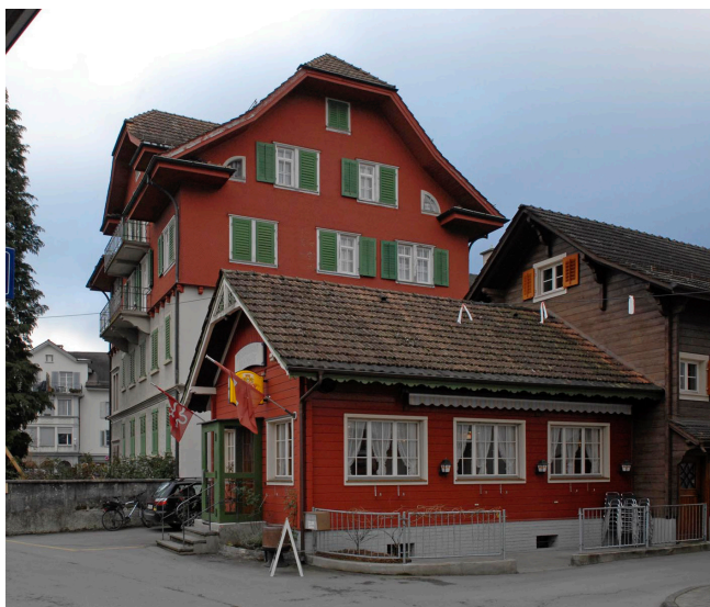
Bild oben: Ansicht von Nordosten Bild unten: Ansicht von Nordwesten