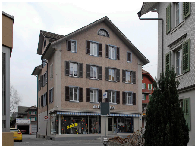
Bild oben: Ansicht von Nordosten Bild unten: Ansicht von Südosten

1952 und 1959 Schaufensterumbau, 1978 Fassadenreovation.