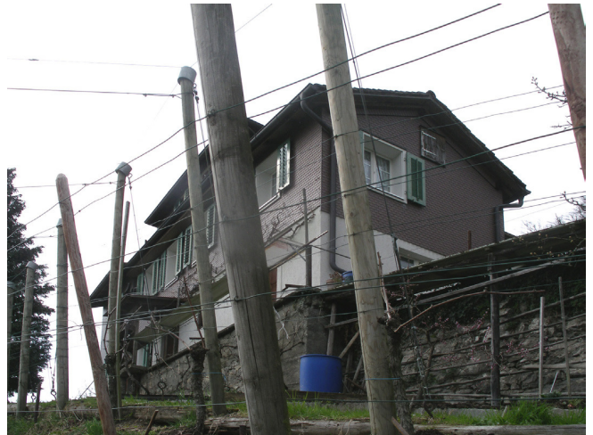
Bild oben: Ansicht von Nordwesten Bild unten: Ansicht von Südosten

Bergli ist die Flurbezeichnung am Fuss des Bürgenberges, der bis heute üblich ist. Traufständiges, zweigeschossiges Wohnhaus unter Satteldach mit Quergiebel. Der Sockel ist verputzt, der Hauptbau ist mit einem Eternitschindelschirm verkleidet. Seit dem 18. Jahrhundert hausten zeitweilig Waldbrüder am Bergli.