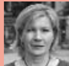
Claudia Slongo Schule