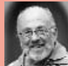
Heinz Odermatt Kirchen, Körperschaften, Vereine Veranstaltungs- kalender